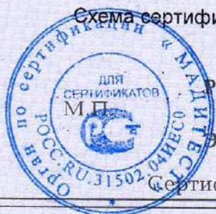
Схема сертификации 2.

Протокола проверки результатов услуг № 250280 от 17.06.2025