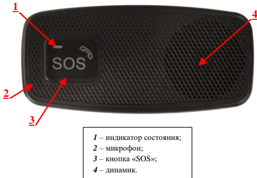
Рисунок 1 - Внешний вид изделия сверху